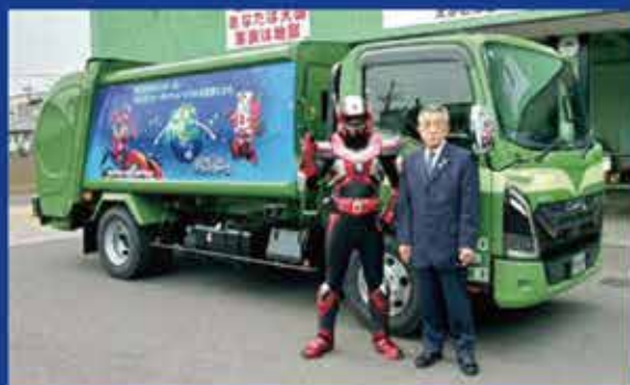
関東実行センター パッカー車