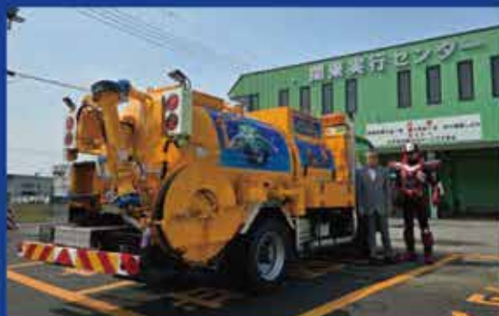
関東実行センター 高圧洗浄車