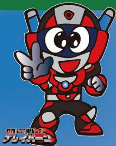
小山市ご当地ヒーロー 開運戦士ブレイバーン